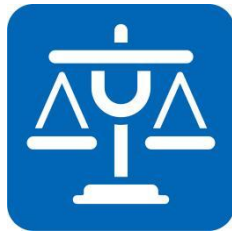
图 A.1 公平秤图形标志