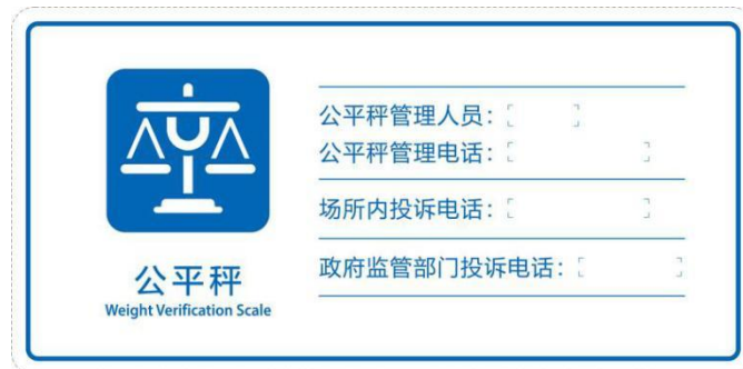
b) 横式公平秤位置标志