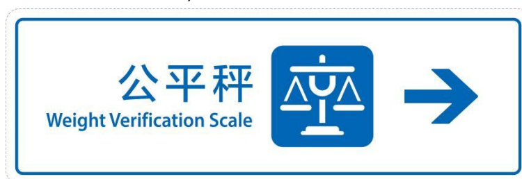
b) 向右公平秤导向标志