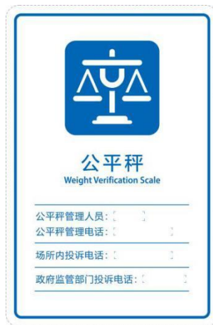
a) 竖式公平秤位置标志