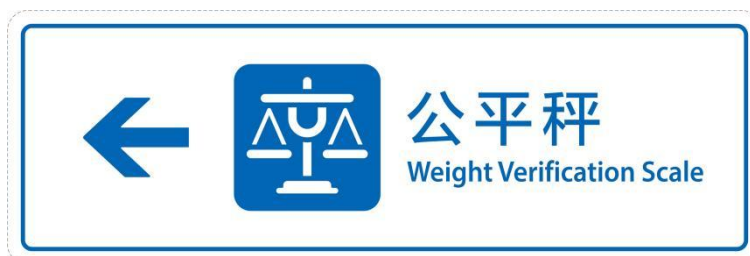
a) 向左公平秤导向标志