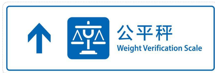
c) 向前公平秤导向标志