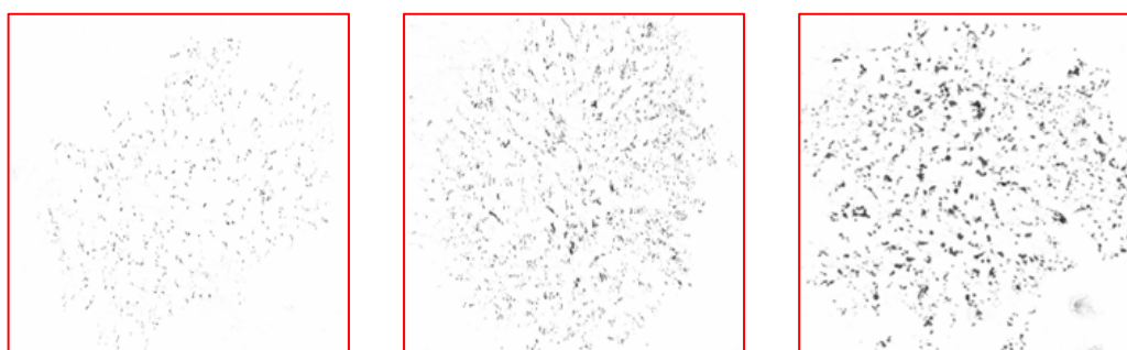
图 1 纸迹试验图例

(c) 出现较为严重的墨迹且粘连呈块状，说明生物基再生液添加量偏高，应适当降低其在生环冷拌料中添加量。